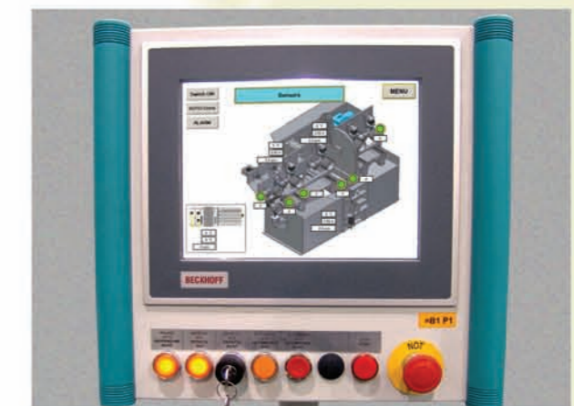
Hochleistungs- SPS mit Vollgrafischem 12" Multi Color Display - Touchscreen.

Patented reject and support flap with large waste chute. Waste wood length up to 400 mm!